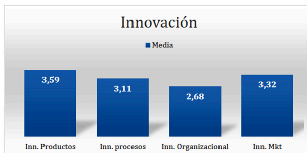
Figura 4. Innovación en pequeñas y medianas empresas de Aguascalientes.

De forma general la innovación de estas empresas presenta un mayor grado de importancia en la dimensión de competitividad de desempeño financiero, seguido por el la reducción de costos y el desarrollo de actividades con apoyo de la tecnología (Figura 4).