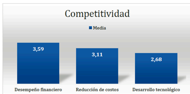
Figura 3. Competitividad en pequeñas y medianas empresas de Aguascalientes