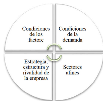
Figura 1. Factores de competitividad de Porter.