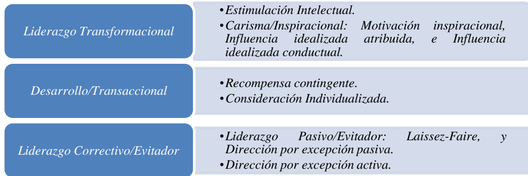
Figura 2. Jerarquía de la variable del MLQ, Vega y Zavala, (2004).

El liderazgo transaccional se conoce así por la relación que existe entre los líderes y su equipo de trabajo y por la manera en que esta es vista como un intercambio de intereses, donde los líderes obtienen rendimiento del equipo y a cambio otorgan beneficios por los logros; por el contrario si estos fallan en alcanzar los objetivos o no obedecen las ordenes se pone en riesgo el rendimiento del equipo de trabajo, lo que conlleva que más tarde el líder reprenda al equipo por no concretar el logro de las metas.