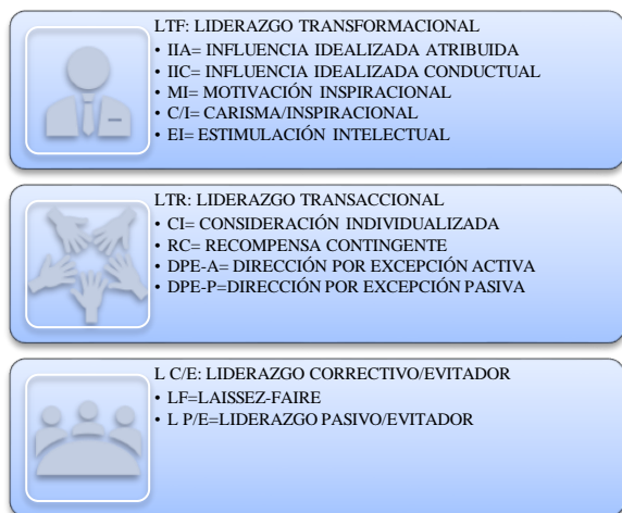
Figura 4. Liderazgos obtenidos para el corporativo VYA Asesores, elaboración propia (2019).