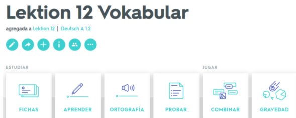
Figura 1. Ejemplo de los modos de entrenamiento